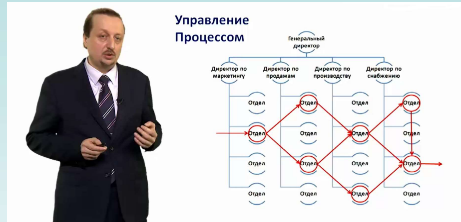
Один оператор, за пультом